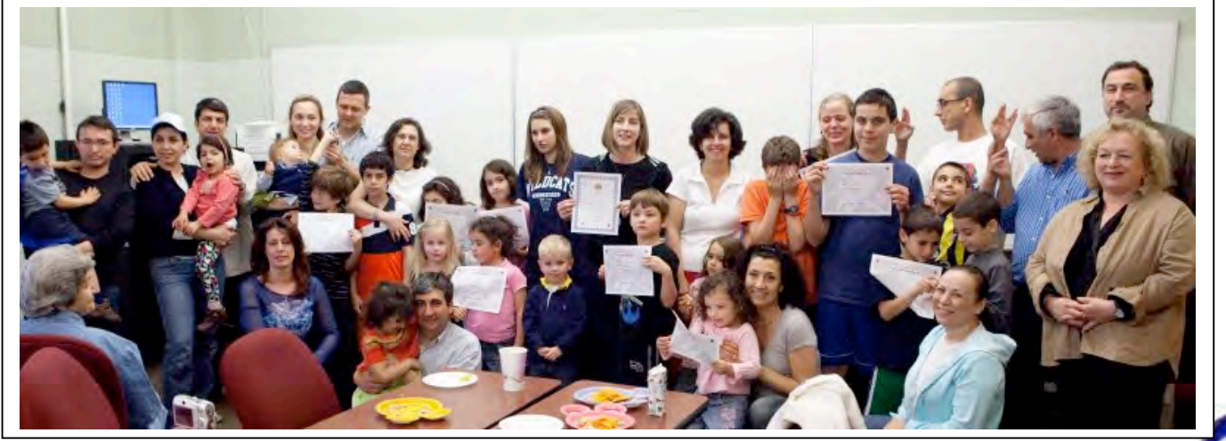
ATA okulunun öğrencileri karnelerini aldıktan sonra başarılarını resimlerle belgelediler